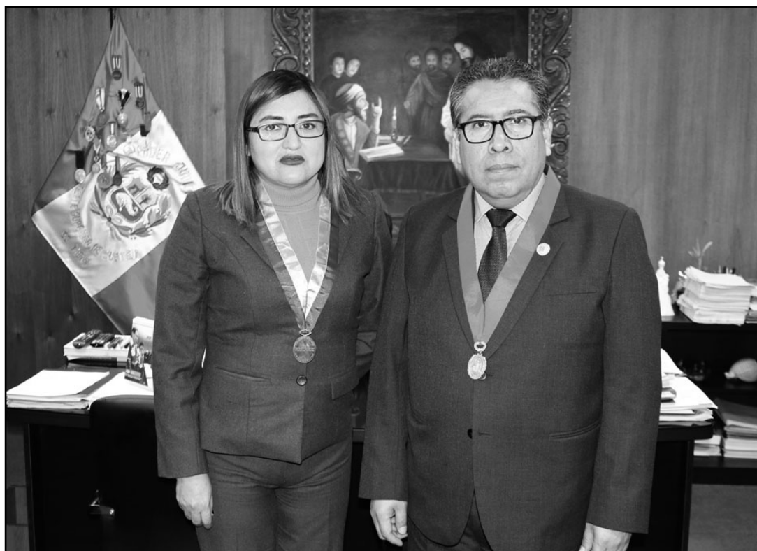
Imagen Institucional Corte Superior de Justicia de Tacna

Uno de los temas abordados fueron las jornadas extraordinarias de descarga procesal que viene desarrollando el Poder Judicial y cómo se pueden mejorar en bien de los justiciables.